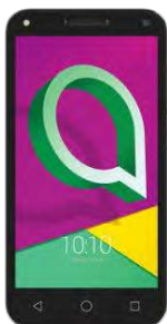
21.01 EUR Alcatel U58GB DualSIM