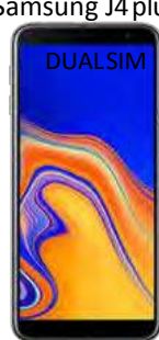
Samsung J4 plus