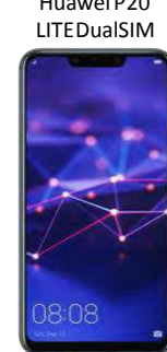
Huawei P20 LITE DualSIM