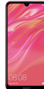
15.97 Eur Huawei Y7 DualSIM2019