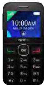
15.97 EUR Alcatel 2008 Senior

Telefoane in limita stocului. Traficul internet ce poate fi consumat in roaming SEE se calculeaza dupa formula reglementata UE.