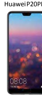
Huawei P20 PRO