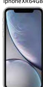
Iphone XR 64GB