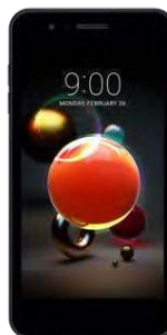
54.62 EUR LG K9