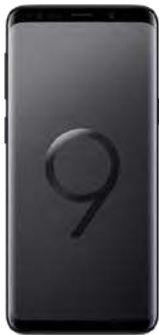
Samsung S9 64GB 0 EUR