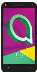
21.01 EUR Alcatel U58GB DualSIM