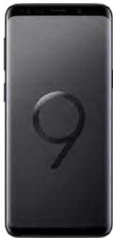
Samsung S9 64GB 0 EUR