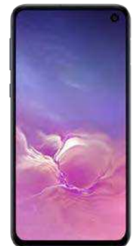
Samsung S10 E 128GB 234.87 EUR

Ab. 10.1 EUR + Ab. 10.1 EUR + Ab. 10.1 EUR + Ab. 10.1 EUR =