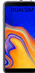
4 EUR fara pachet protectie