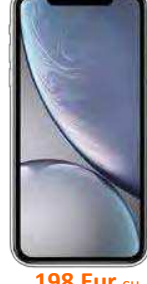
198 Eur cu pachet protectie 170EUR fara pachet protectie