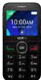
15.97 EUR Alcatel 2008 Senior

Telefoane in limita stocului. Traficul internet ce poate fi consumat in roaming SEE se calculeaza dupa formula reglementata UE.