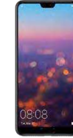
92.87 Eur cu pachet protectie 66.39 EUR fara pachet prot.