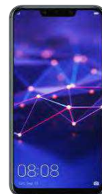
12.86 Eur cu pachet protectie 0 EUR fara pachet protectie