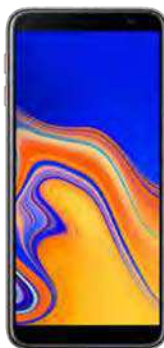
Samsung J4 Plus DUAL SIM 4 EUR