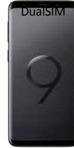
39.34 EUR cu pachet protectie 0 EUR fara pachet protectie