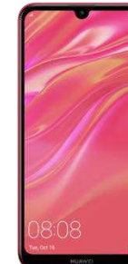
15.97 Eur Huawei Y7 DualSIM2019