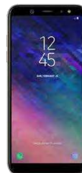
Samsung A6 Dual SIM 2018 0 EUR

Ab. 10.1 EUR + Ab. 10.1 EUR + Ab. 10.1 EUR + Ab. 10.1 EUR =