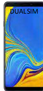
9.83 EUR cupachetprotectie 0 EUR fara pachet protectie