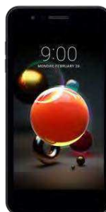
54.62 EUR LG K9