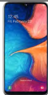
Samsung Galaxy A04 19.33 EUR