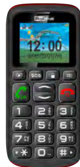
Maxcom MM 428 0 EUR

Detalii despre zonele de tarificare roaming pe www.orange.ro . In tarile non-membre UE are loc tarificarea traficului Internet: Serbia / Macedonia Moldova / Elvetia / etc.