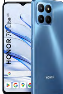
Honor 70 lite 5G 0 EUR