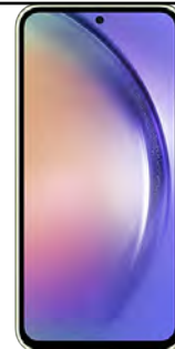
Samsung A54 5G 128GB 0 EUR