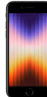
iPhone SE 64GB 0 EUR