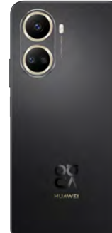
Huawei Nova 10SE 128GB 0 EUR