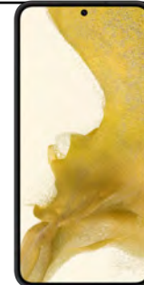
Samsung S22 5G 128GB 5.88 EUR