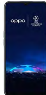
Oppo A17 4GB 64GB 27.73 EUR