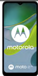
Motorola E13 64GB 46.22 EUR

Pentru telefoanele premium (ex. Samsung S sau Note, Iphone) este necesara precomanda la Orange, ulterior se primeste confirmarea de rezervare si termenul estimat de livrare