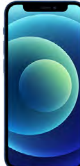
iPhone 13 128 GB 0 EUR